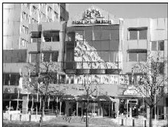
Die Spielstätte, das BCA-Hotel Wilhelmsberg. Das ist auch die Spielstätte des „Lichtenberger Sommers“

Überraschenderweise gehörten bei den Mannschaften mit dem SC Friesen Lichtenberg e.V. und im Einzel die Spfrd. Steinhagen und Dauth auch Berliner Vertreter dazu. Von den Bewerbern für diese Endrunde erhielt Berlin den Zuschlag und somit konnte in der Hauptstadt ein weiteres Schachevent geboten werden.